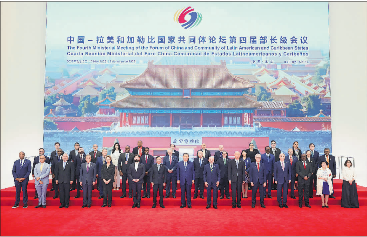
5月13日上午，国家主席习近平在北京国家会议中心出席中国—拉美和加勒比国家共同体论坛第四届部长级会议开幕式并发表主旨讲话。这是习近平同与会嘉宾集体合影。